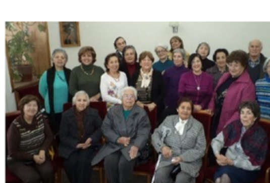
Tertulia Literaria 2013

El Grupo Literario del Club Alemán, en el marco de los 175 años del Club Alemán, invita a una tertulia abierta a todo público, la que tendrá lugar el martes 3 de septiembre a las 15:30 horas . En la ocasión, se comentará la novela "Jamás el fuego nunca" de la autora chilena Diamela Eltit (1949). Entrada liberada.