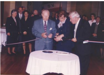
El renovado salón fue inaugurado el 9 de mayo de 1997